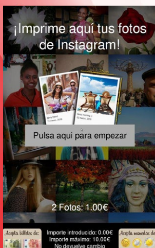
1 introducir el hashtag